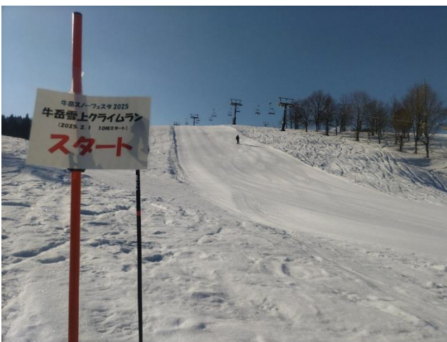
スタート地点 (この日は10時現在、路面はカンカンでした)