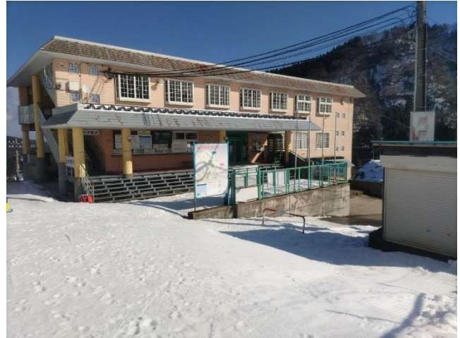
この建物のB1Fが受付①です