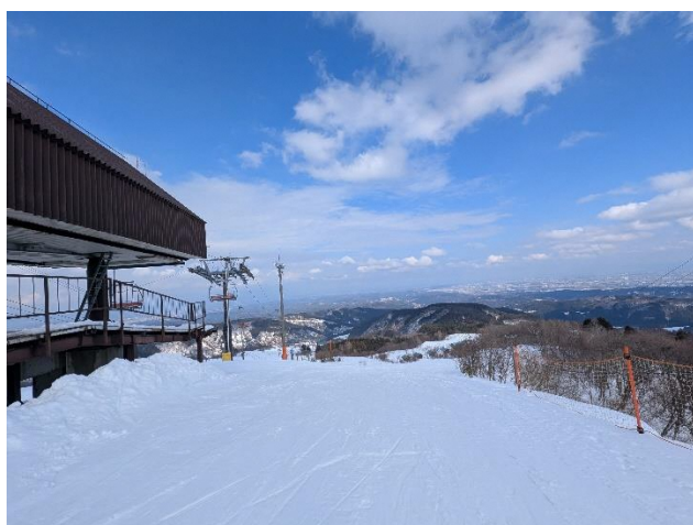
ここまで登ります。天気が良けれ眺望は最高です。