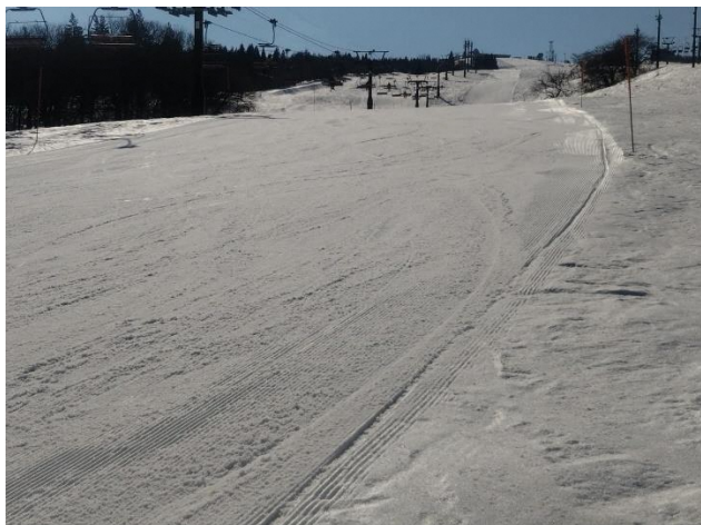
コース途中（雪上 走れます）