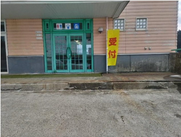
受付①：ゼッケン・参加賞を渡します。