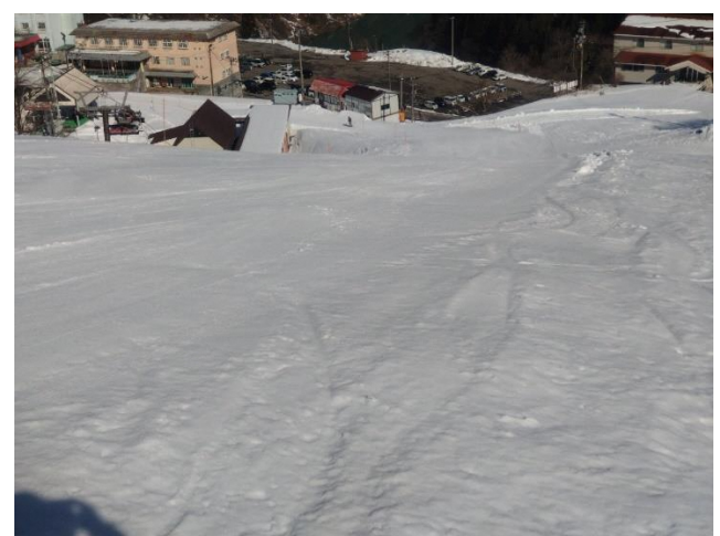
スタート直後の登り（ダッシュすると持たないかも？）