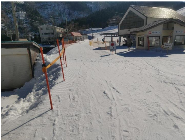
ここを通過してスタート地点へ