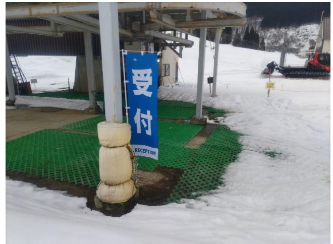
受付②：頂上までの荷物（防寒具等）を預かります